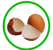
CÁSCARAS DE HUEVOS