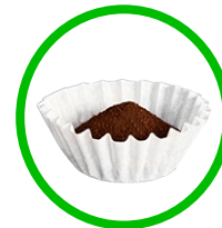
POSOS DE CAFÉ